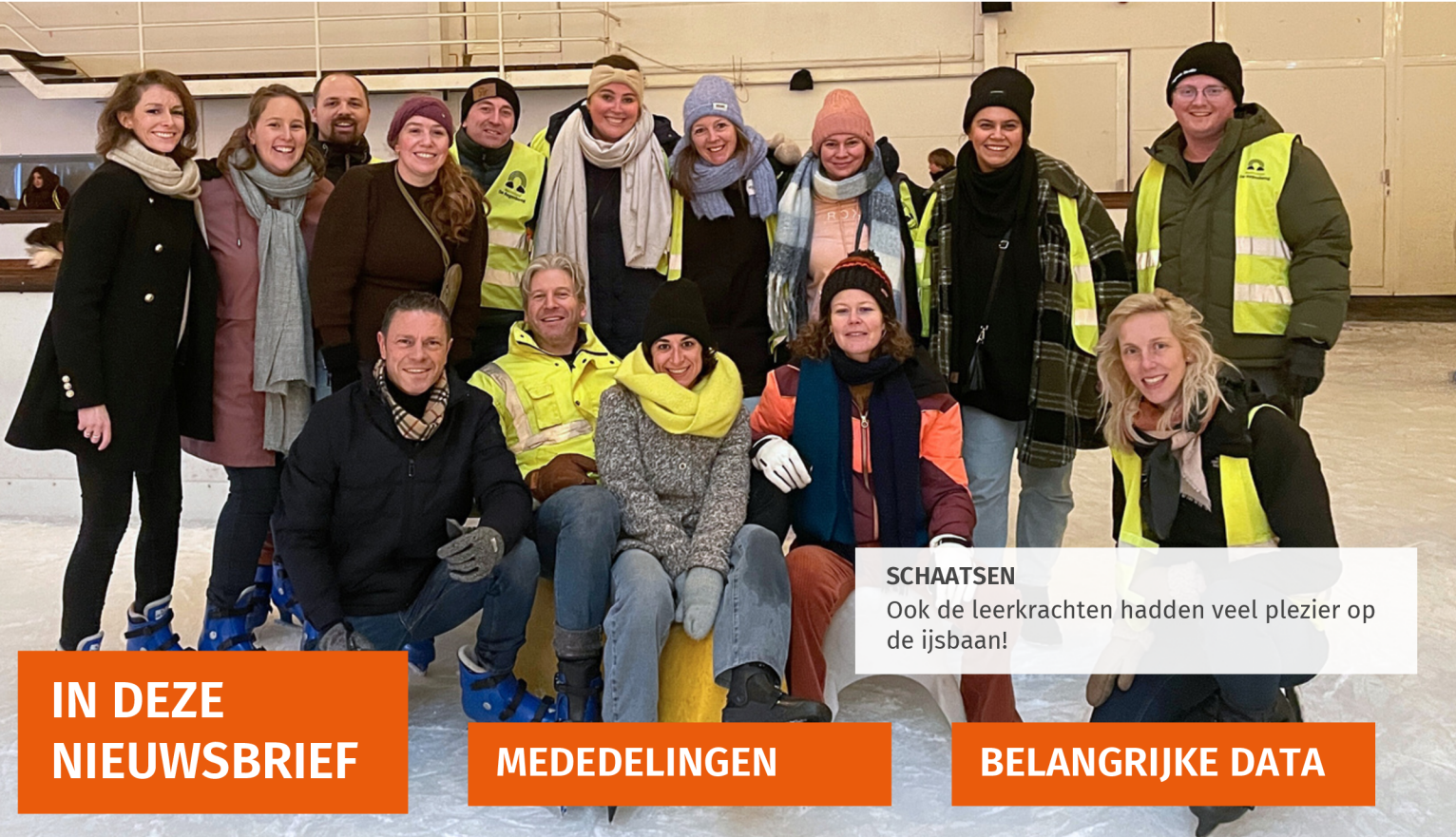
SCHAATSEN Ook de leerkrachten hadden veel plezier op de ijsbaan!