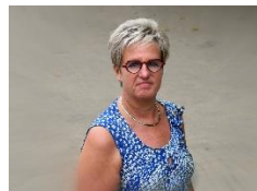
Sofie/Ann Beleidsondersteuner Inschrijvingen - info