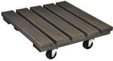
plantenroller / meubelroller