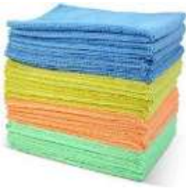
dekens, doeken, lakens