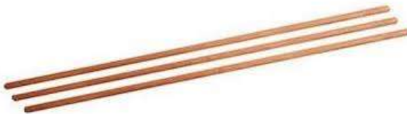
bezemstelen / stokken