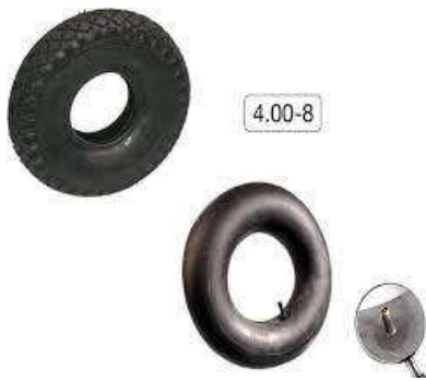
binnen- en buitenbanden