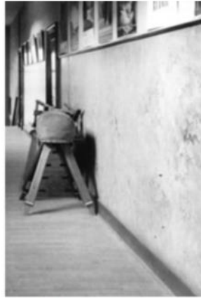
Désiré Van Monckhovestraat