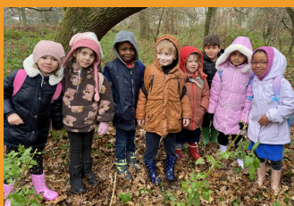
De kleuters in het Heidebos

De ouders van K3 kregen info rond schoolrijpheid via een parcours met de juffen en de kleuters.