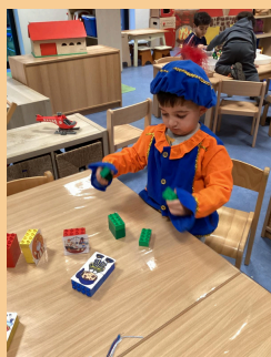
Komt de Sint?