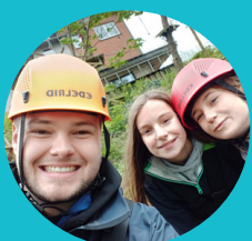
L6 op meerdaagse