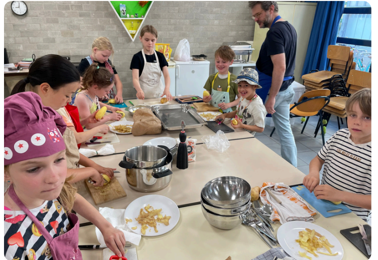
Kookatelier met ouders, tuin van Kina, dagje zee, Blaarmeersen, op bezoek in het stadhuis.