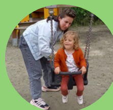
Schoolreis met K1