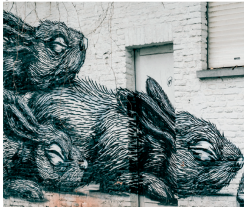
● 32 ROA

SAM SCARPULLA ● 39 40 80 Sam Scarpulla is fresh en funky. Hij maakt de laatste jaren vooral grafische zwartwitwerken waarmee hij aan de hand van figuren en symbolen een verhaal vertelt.