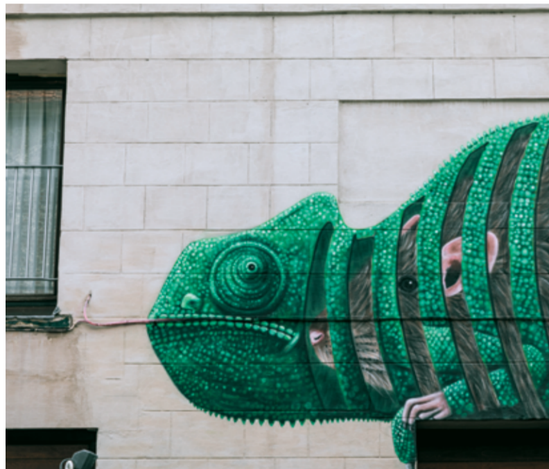
● 36 CEE PIL

BASTARDILLA (Colombia) ● 41 42 Bastardilla, een sterke Colombiaanse vrouw, staat internationaal bekend om haar sierlijke figuren en sprookjesachtige penseelvoering. In haar werk klaagt ze sociale kwesties aan en komt ze op voor de rechten van de vrouw.