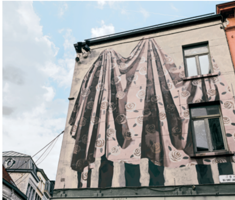
● 62 HYURO

SORRY, NOT SORRY staat voor straatkunst in Gent. De Stad Gent voert al jaren een actief beleid rond graffiti en street art. Cultuur Gent ondersteunt individuele graffiti kunstenaars, geeft advies en zet projecten op zoals het SORRY, NOT SORRY Straatkunstfestival.