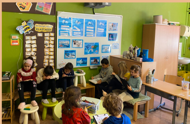
Instructie 2e in de kring

Ook tijdens het tutorlezen op woensdag halen we onze letterdoosjes uit!