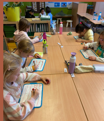
De eerstes oefenen hun krulletters op whiteboards